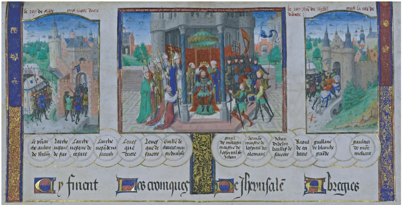
Folio 18v. Juan de Briennes es coronado rey de Jerusalén en Acre.

A la muerte de Godofredo en 1100 le sucedió su hermano Balduino I (habría más reyes con el nombre de Balduino). Antes de Jerusalén habían sido tomadas Nicea (para el emperador Alejo de Constantinopla), Edesa, Antioquía, y otras ciudades; pero a partir de Balduino I el reino latino de Jerusalén se extendió por toda Siria.