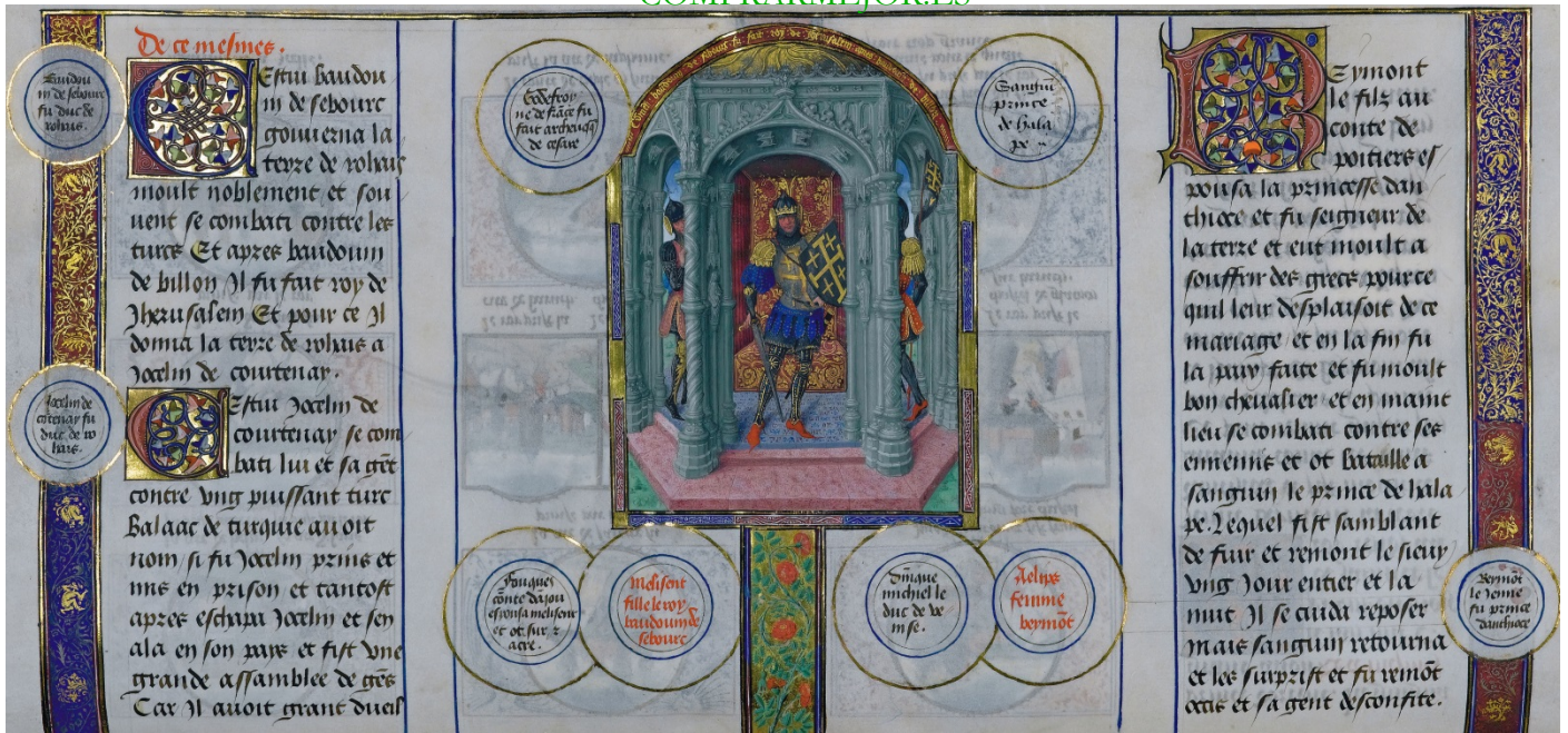
Folio 11r. Balduino de Le Bourg, rey de Jerusalén.

A la muerte de Godofredo en 1100 le sucedió su hermano Balduino I (habría más reyes con el nombre de Balduino). Antes de Jerusalén habían sido tomadas Nicea (para el emperador Alejo de Constantinopla), Edesa, Antioquía, y otras ciudades; pero a partir de Balduino I el reino latino de Jerusalén se extendió por toda Siria.